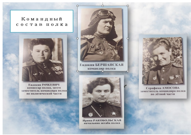
Командный состав полка

Наши техники утверждают: к этому странному русскому самолёту подвешиваются 4 бомбы по 50 или 2 по 100 кг. За последние сутки на нас упало около несколько тонн бомб, ведьмовское самолёты появляются с интервалом в пять минут... Женщины столько поднять не могут. Это точно не люди. Эти ведьмы объявлены личным врагом фюрера. За сбитый их самолет полагается железный крест. Мы научились ловить их светом и тут же бить по ним. Так и тут они нас обхитрили они тут же сгорают не долетая до земли. В одну ночь нам удалось сбить 4 самолета. Я очень хочу поймать одну из них лично и плюнуть на хвост этой русской ведьме».